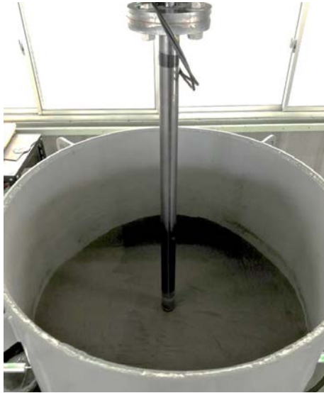
月面模擬砂の入った土層

2024 年度は、絞り込んだ構造物を対象に試設計を行い、施工データを設計へ反映させるまでの具体的なフローを検討するなど、これまでに得た知見を活かしてさらなる検証を進めてまいります。