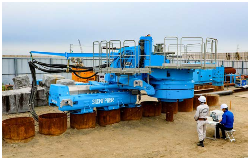
2023年度に行った月面想定地盤での実大実験の様子

※ 参考：国土交通省ウェブサイト ( https://www.mlit.go.jp/report/press/kanbo08_hh_001089.html )