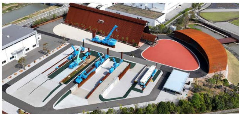
RED HILL 1967