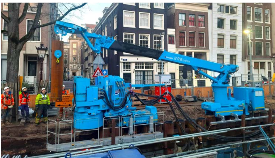
実証施工中の様子

※2 商業化フェーズでは、8 年間で計 3.3km 区間の工事受注が保証されています。