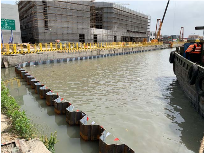
上海市「蘇州川」での堤防補強工事