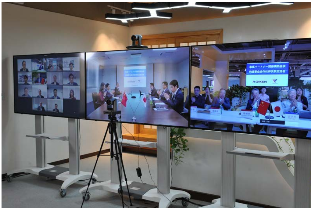
オンラインで行われた事業パートナー関係構築に向けた会談の様子

天遠社では、機械の販売や維持管理だけでなく、工法提案、現場施工を展開していくことも見据えています。当社は同社との連携を深め、中国における圧入ビジネスの拡大を加速させていきます。