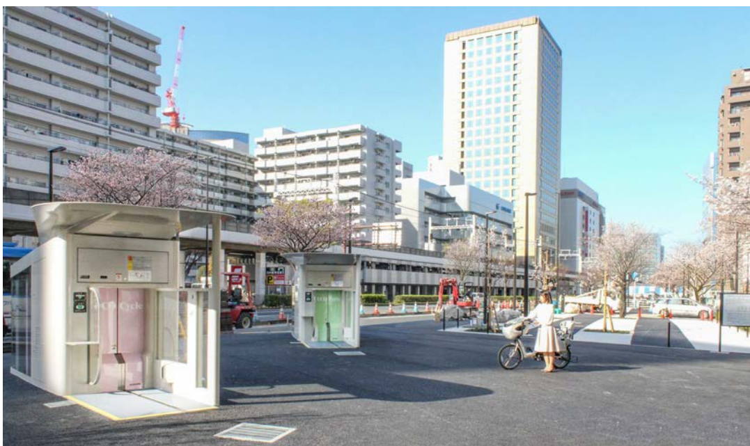
完成したエコサイクル（川崎駅東口周辺自転車等駐車場第5施設）

今回を含めるとエコサイクルの設置は全国23カ所、57基となりました。現在、東京都内の2カ所で設置が予定されており、今後も採用拡大が期待されます。