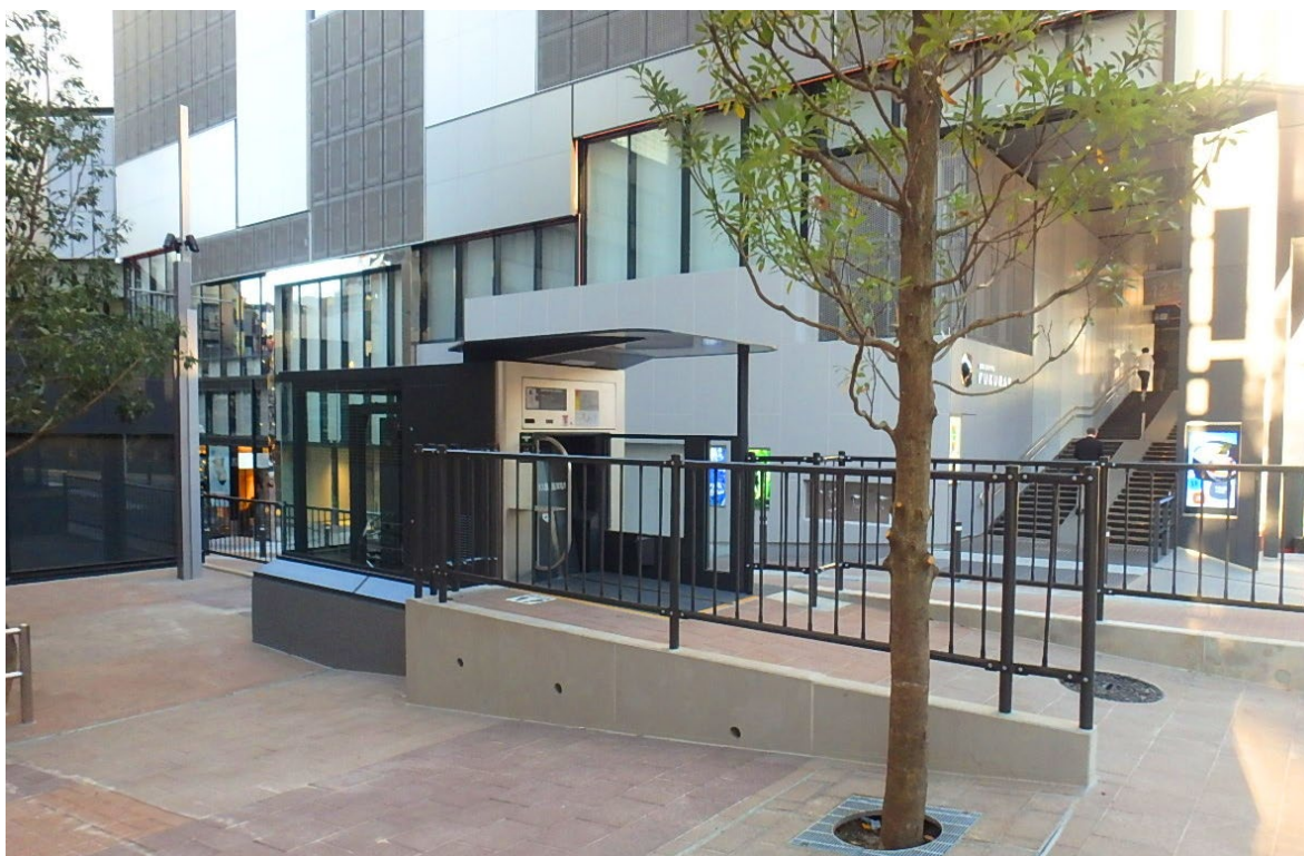
「渋谷フクラス」に隣接して設置された「エコサイクル」

「地上に文化を、地下に機能を」を製品コンセプトとする「エコサイクル」は、本案件が全国で22箇所、55基目の設置となり、首都圏では15箇所、40基目の設置となります。また現在、神奈川県川崎市でも2基の設置が進んでおり、2020年4月にオープン予定です。