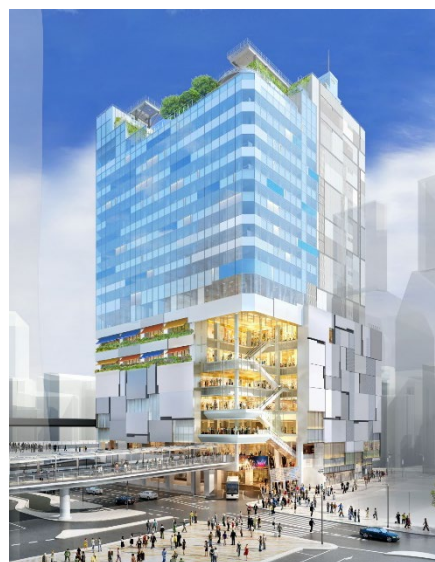
12月5日に開業予定の「渋谷フクラス」