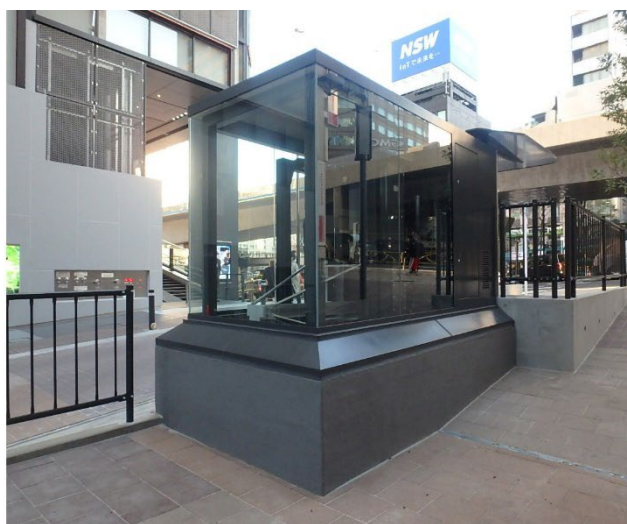
入出庫ブースは、周辺の建物と調和するデザインとした