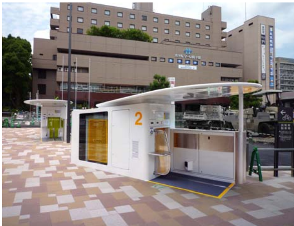
地上部写真（入出庫ブース）

7月1日（木）より吹田市による運用が開始されるなか、放置自転車対策に悩まされている京阪神地区の多くの自治体から注目を集めている。