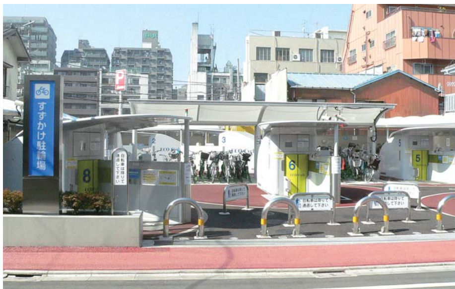
すすかけ通り側出入口

三鷹駅南口から徒歩5分。閑静な住宅地にある664㎡の敷地に、エコサイクル8基を機能的に配置し、地下に1440台の自転車を収容する。周辺の住環境に影響を与えず、従前の平置き時に比べ3倍の収容能力を確保した。