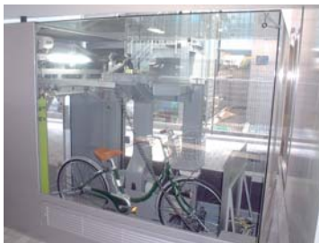
ガラス張りのブース側面