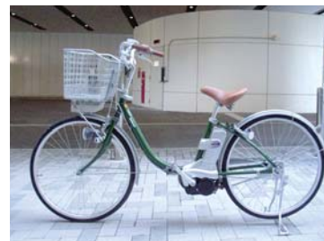
自動充電システム対応 電動アシスト自転車

144台の自転車を地下に収容。8層構造のうち、上2層に充電装置を装備し、電動アシスト自転車が収容中に自動充電されるシステムとなっている。ガラス張りの入出庫ブースは、搬器の昇降旋回を見学できるショールームとしての役割も果たしている。