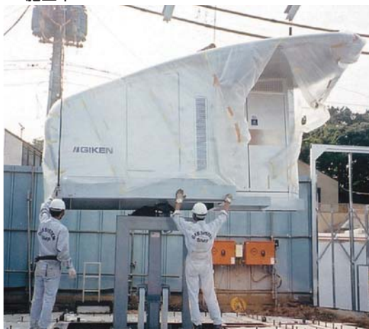
入出庫ブース設置