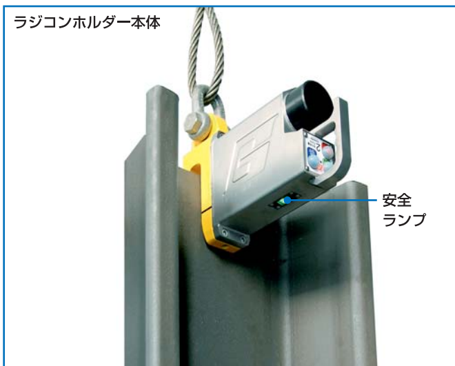
ラジコンホルダー本体