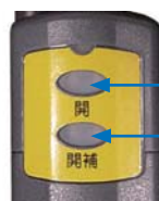
「開」、「開補助」同時操作